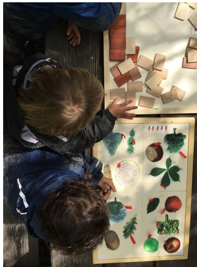
Photos ci-dessus : à gauche Jessica et à droite apprentissage sur le thème des arbres